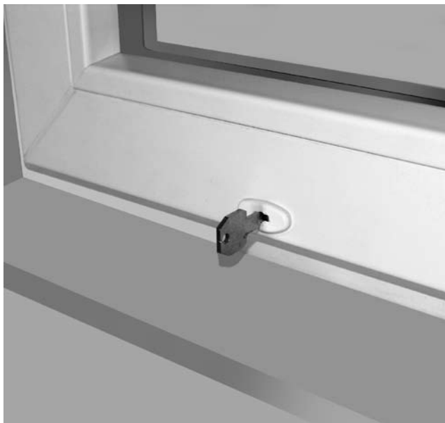
Детский замок блокирует открытие окна детьми.

Если вы не можете на долгое время оставить детей без присмотра, опасаясь открытого окна, тогда так называемый оконный замок для безопасности детей просто незаменим.